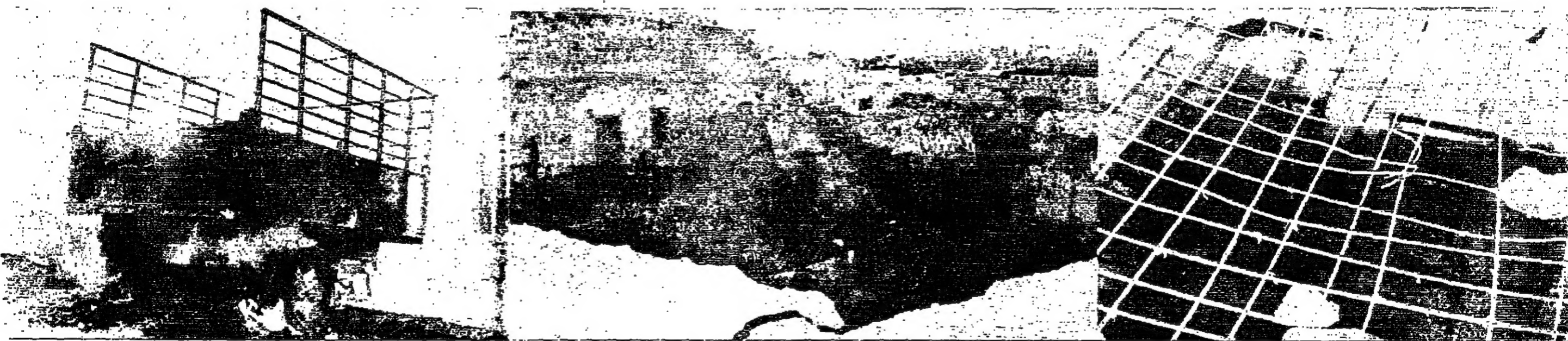
القطر مصور الدستور وتسميم التصوير في الجيش و « غلوبي » الجبهة من صور العدوان الإسرائيلي الفاشل على القرى الأردنية المحتلة طوال يوم أمس . وتبدو في الصورة الأولى مدرسة تم تدميرها وقد ذهبت اقبال بسيفها . وفي الثانية مجموعة من القتلى التي هدمها العدوان الجبان . وفي الثالثة عربة تراكور تشتعل نيرانها في الحرائق